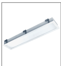
IP 65; T8; Kl. Ochr.I