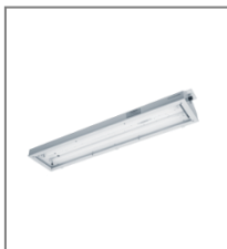
IP 65; T8; Kl. Ochr.I; (max.temp. otoczenia +70°C)