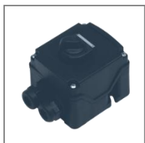
II 2G Ex ed IIC T6; II 2D IP 66 T55°C