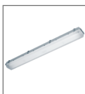
IP 67; T5; Kl. Ochr.I

Oprawa wyposażona w statecznik elektroniczny.