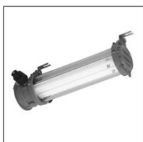
II 2G Ex de IIC T6; II 2D Ex tD A21 IP66 T80°C; TC-L; Kl. Ochr. I