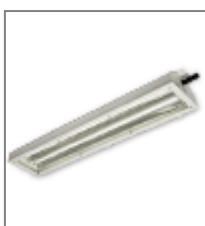
IP 65; T5; Kl. Ochr.I; (max.temp. otoczenia +70°C)

PC - klosz poliwęglan G - klosz szkło hartowane