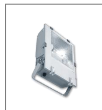
IP 65; HIT/HST; Kl. Ochr. I