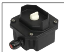
II 2 G Ex ed IIC T6 Gb II 2 D Ex t IIIC T 80°C IP 65 Db