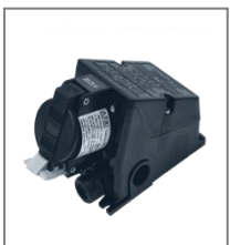
II 2G Ex de IIC T6-T5; II 2D Ex tD A21 IP 66 T68°C