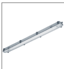
IP 65; T5; Kl. Ochr.I

Oprawa może być wyposażona w stat.elektroniczny