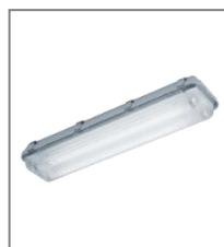
IP 67; T5; Kl. Ochr. I

Oprawa wyposażona w statecznik elektroniczny