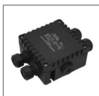
II 2D tD A21 IP 66 T80°C