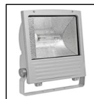
IP 65; HIT/HST; Kl. Ochr. I

OS-odbłyśnik symetryczny OA-odbłyśnik asymetryczny