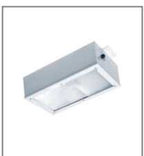
IP 65; HIT/HST; Kl. Ochr. I

OS-odbłyśnik symetryczny OA-odbłyśnik asymetryczny B15d-oprawa z dodatkowym źródłem światła