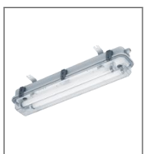
IP 67/66; T8; Kl. Ochr.I