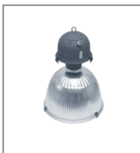
IP 65; HI/HS; Kl. Ochr. I