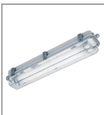
IP 67/66; T5; Kl. Ochr.I

E - oprawa wyposażona w statecznik elektroniczny