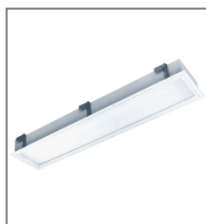
IP 65; T5; Kl. Ochr.I

Oprawa wyposażona w statecznik elektroniczny.