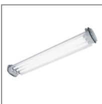
IP 65; T8; Kl. Ochr.I