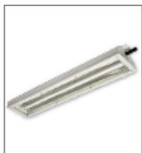
IP 65; T5; Kl. Ochr.I