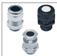
II 2G Ex e II c; II 2D Ex tD A21 IP 68;