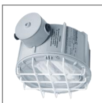
II 2G Ex de IIC T6-T5; II 2D Ex tD IP 66 T75°C-93°C; A21; Kl. Ochr. I