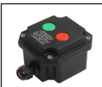
II 2 G Ex ed IIC T6 Gb II 2 D Ex t IIIC T 80°C IP 65 Db