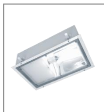
IP 65; HIT/HST; Kl. Ochr. I