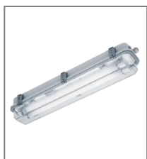
IP 67/66; T8; Kl. Ochr.I

Oprawa wyposażona w statecznik elektroniczny.