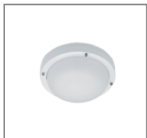
IP 67; TC-D; A80; Kl. Ochr.I