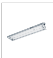
IP 65; T8; Kl. Ochr. I