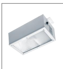
II 3G Ex nR IIC T3-T2; II 3D Ex tD A22 IP 65; T165°C-260°C; HST/HIT; Kl. Ochr.I

A3 - układ awaryjny 3h PC - klosz poliwęglan G - klosz szkło hartowane S - obudowa nierdzewna