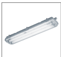
IP 65; T8; Kl. Ochr.I