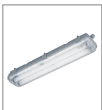
IP 65; T5; Kl. Ochr.I

E - oprawa wyposażona w statecznik elektroniczny