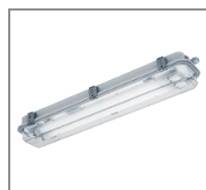
IP 67/66; T8; Kl. Ochr.I