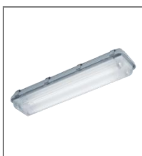
IP 67; T8; Kl. Ochr. I