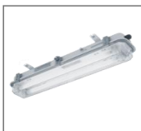
II 2G Ex de II T5; IP 66/67; T8; Kl. Ochr. I