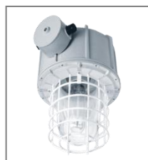
II 2G Ex de IIC T4-T3; II 2D Ex tD IP 66 T110°C-141°C; A21; Kl. Ochr. I