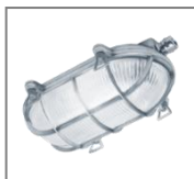
IP 65; A80 ; Kl. Ochr. I