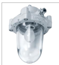
II 2G Ex d IIB T4; II 2D IP66 T135°C; A80; Kl. Ochr. I