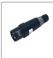
II 2G Ex de IIC T6-T5; II 2D Ex tD A21 IP 66 T68°C