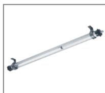
IP 68; T8; TC-D; Kl. Ochr.I