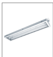
IP 65; T8; Kl. Ochr.I; (min. temp. otoczenia - 30°C)