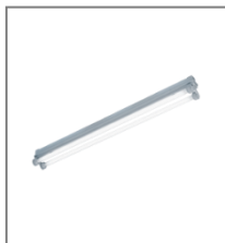
IP 65; T8; Kl. Ochr.I