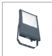
IP 65; HI/HS; Kl. Ochr. I