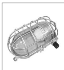
II 2G Ex d IIC T3-T2; I M2 ed I A; Kl. Ochr. I