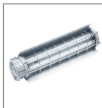
II 2G Ex d IIB lub IIC T6-T5; II 2D Ex tD A21 IP68 T80°C-110°C; T8; Kl. Ochr. I